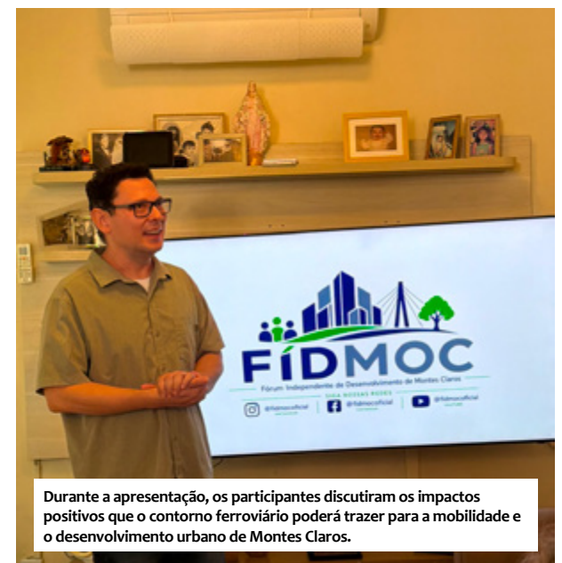
Durante a apresentação, os participantes discutiram os impactos positivos que o contorno ferroviário poderá trazer para a mobilidade e o desenvolvimento urbano de Montes Claros.