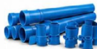
TUBOS E CONEXÕES