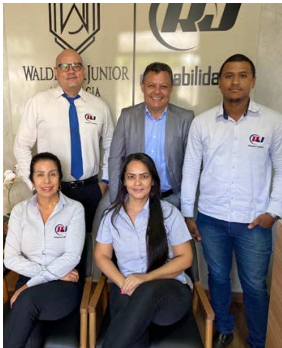
Equipe RJ Contabilidade e Consultoria Ltda Contabilidade para médicos

Somos especializados em contabilidade para médicos. Portanto, temos uma proposta a lhe fazer. Venha tomar um café conosco, vamos entender juntos todos os seus propósitos e avaliar a melhor situação para que você exerça à sua profissão de forma rentável e sustentável financeiramente.