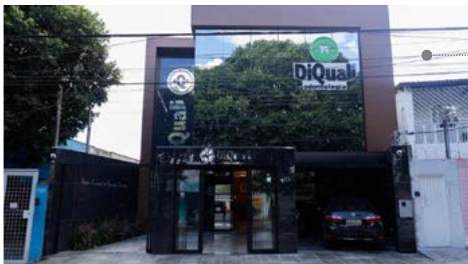
A DiQuali Odontologia está localizada a Avenida Francisco Sá, 113 - Centro - Montes Claros/MG