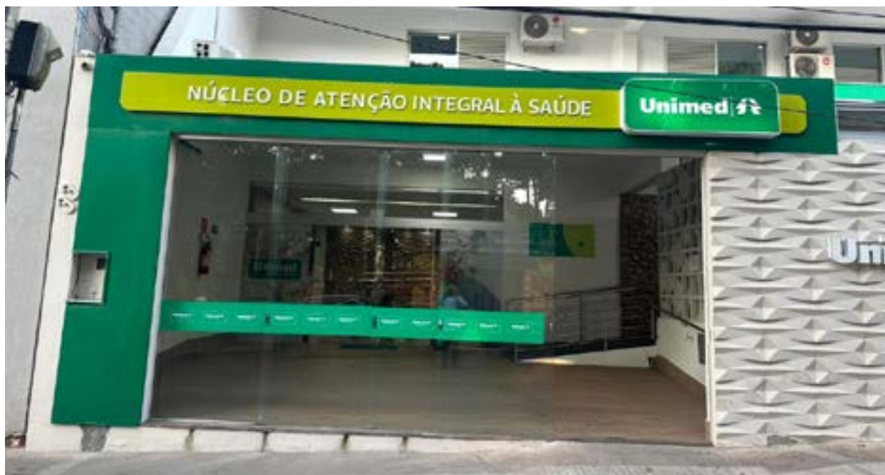
O NAIS já realizou cerca de 30 mil atendimentos em cinco meses entre crianças e adultos