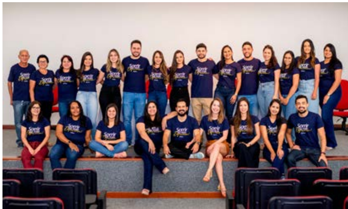
Equipe da Rede Dentales durante treinamento

“Ir ao dentista não é uma atividade agradável para a maioria das pessoas, muitos ainda têm receio de procurar esse profissional porque não tiveram uma boa experiência, anteriormente. Aqui na Rede Dentales buscamos desconstruir isso, pois os nossos pacientes têm um tratamento diferenciado, desde a recepção até a conclusão do tratamento. Para isso, precisamos