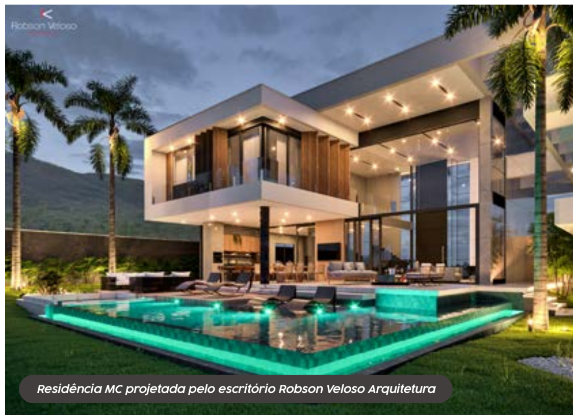
Residência MC projetada pelo escritório Robson Veloso Arquitetura